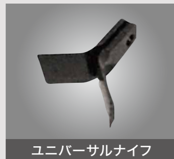
ユニバーサルナイフ