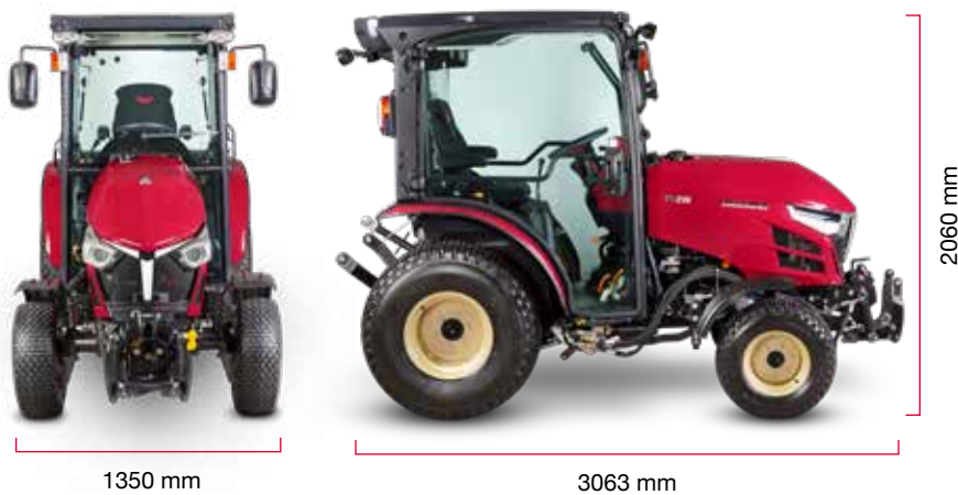
A largura e a altura podem variar, com base no tipo de pneu.