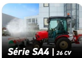
Série SA4 | 26 CV

Premières 50h Toutes les 250h Après 500h Après un an Après deux ans