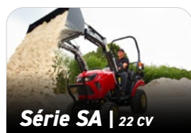
Série SA | 22 CV

Cliquez sur l'image ou sur l'un des intervalles d'entretien dans une colonne du tracteur pour passer directement à la vue d'ensemble de leurs kits de pièces.