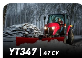
YT347 | 47 CV

Premières 50h Toutes les 250h Après 500h Après un an Après deux ans