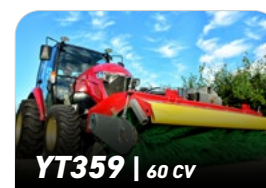
YT359 | 60 CV

Premières 50h Toutes les 250h Après 500h Après un an Après deux ans