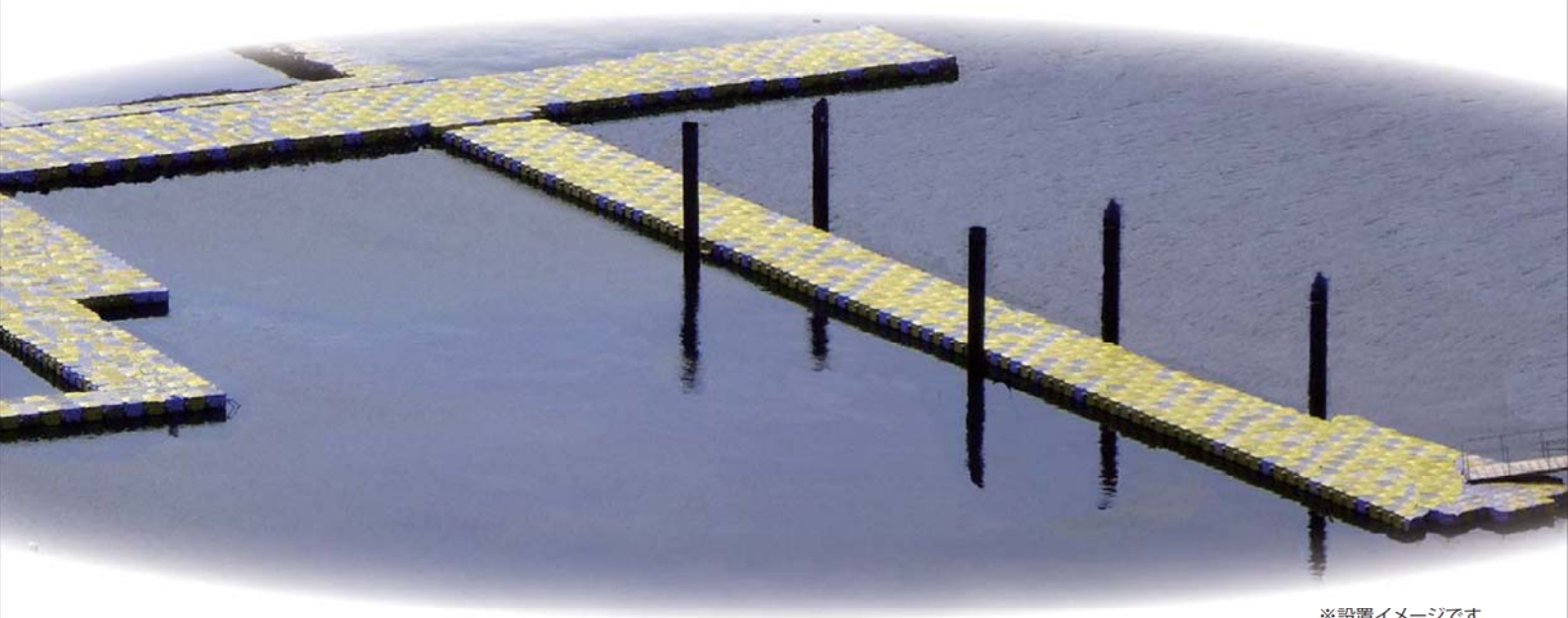
※設置イメージです。