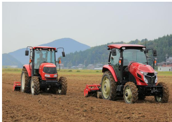
＜ロボットトラクタによる無人運転と随伴作業の様子＞

ヤンマーの「ロボットトラクタの研究開発」が、「第 7 回ロボット大賞(農林水産大臣賞)」を受賞しました。