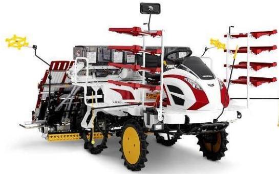
<乗用田植機「YR-D 密苗仕様」>

ヤンマー株式会社(本社:大阪市、社長:山岡健人)は、新型田植機「YR-D シリーズ」の追加仕様として、高密度に播種した苗を正確に植え付ける「YR-D 密苗仕様」4機種を12月1日より販売開始します。また、田植機オプションとして、「YR-J/RJ シリーズ」に対応した「密苗キット」を追加し、2017年2月より販売を開始します。