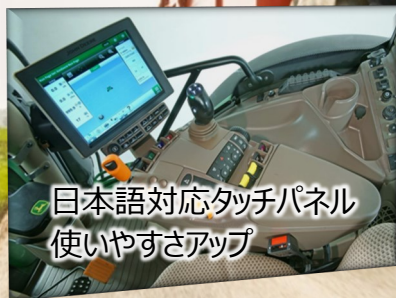
日本語対応タッチパネル 使いやすさアップ