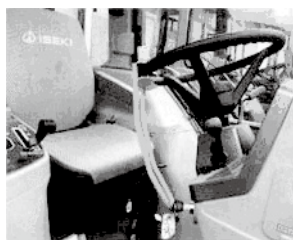
ハンドルロック使用例