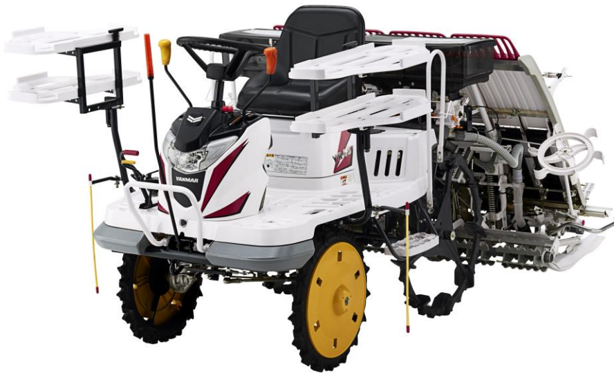
<ヤンマー乗用田植機「YR4Sシリーズ」>

ヤンマー株式会社(本社:大阪市、社長:山岡健人)は、「安心・安全・省力作業・簡単操作」を実現した乗用田植機「YR4Sシリーズ」6機種を7月1日(土)より発売します。