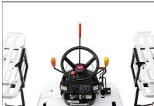
<苗の減少をお知らせする視認性の高い「センターマーカ―」>