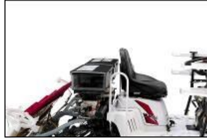
<左: 枕地の巡回跡を均平にする「すこやかロータ」、右:「ミッドマウント施肥機」>