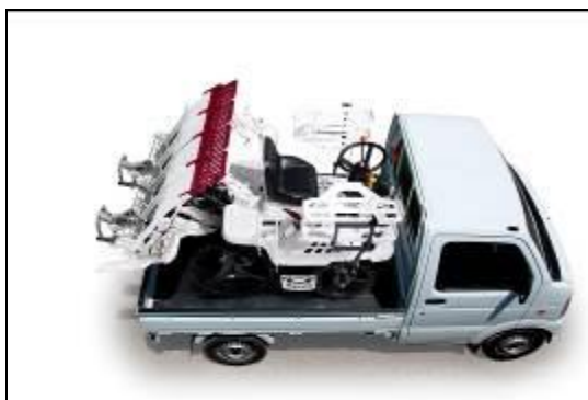
<軽トラックにも積載可能なコンパクト仕様>