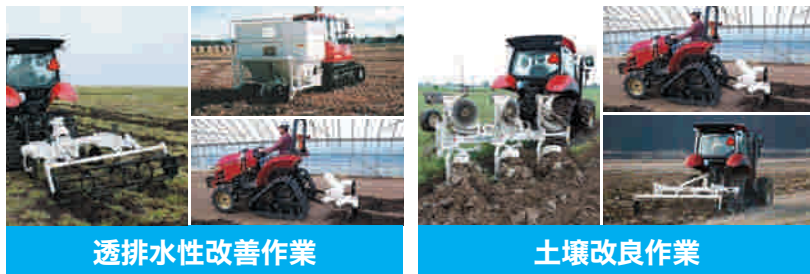
透排水性改善作業

当日会場にて、お客様の水田を汎用田化するために必要な作業や、それに必要な各種作業機などをご提案・ご説明いたします。