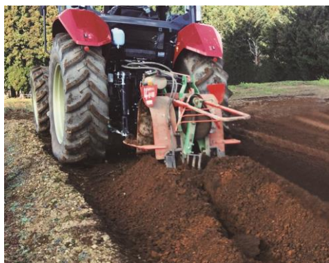
<「クリープ速」での長いもの掘り取り作業>

従来機 ※4 ではオプション設定であった、超低速走行での作業が行える「クリープ速」を標準装備としました。本機種では、副変速段数を2段から3段に増やしたことで、お客様の作業に最適な速度の設定が可能となりました。例えば、畑作における長いもの掘り取り作業などにおいて、安定した低速走行で力強い作業を実現します。