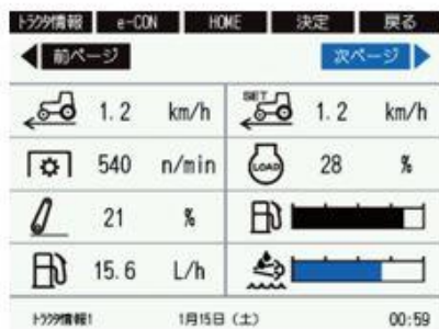
トラクター情報画面