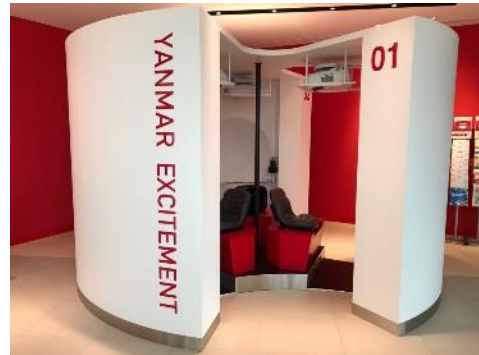
＜歴史商品と未来のコンセプト建機、コンセプト建機シミュレーター＞