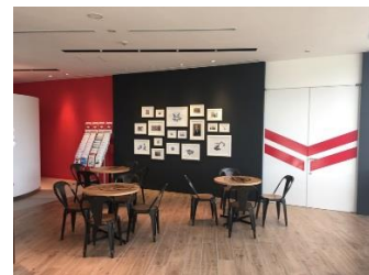
＜左：タッチ操作が可能なプロジェクター、中：ジオラマや工場 Live 配信、右：カフェスペース＞