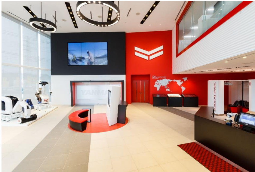
<ヤンマー建機ショールーム>

ヤンマー建機株式会社(本社:福岡県筑後市、社長:瀬戸智行)は、当社建機事業の歴史や未来のコンセプト商品を展示するショールームを、2018年3月16日にヤンマー建機本社内に開設しました。