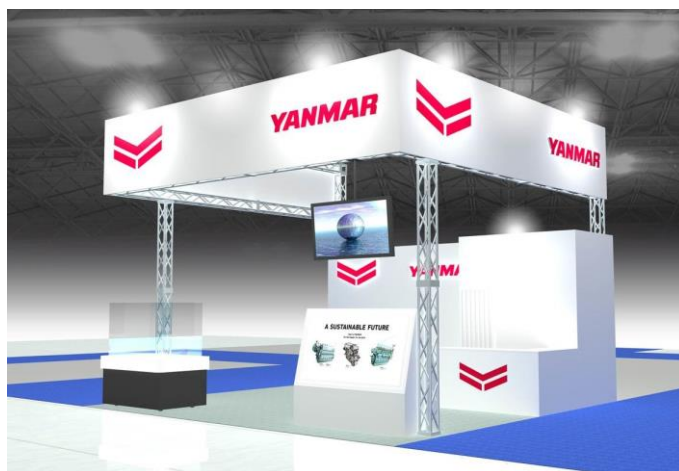
<「SEA JAPAN 2018」ヤンマーブースのイメージ>