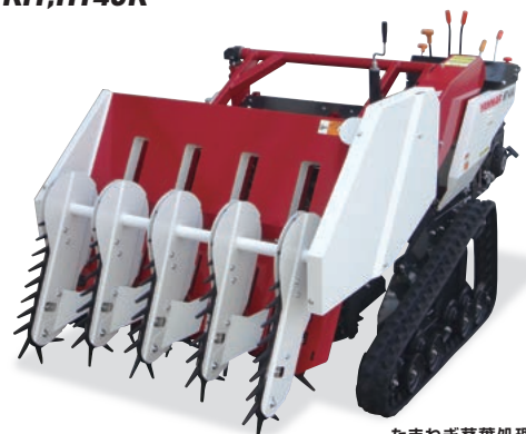
たまねぎ茎葉処理機 HT40K