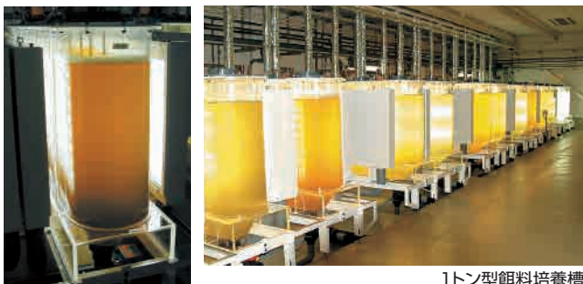
1トン型餌料培養槽

培養に使用する1トン型水槽は、光の照射効率と洗浄性の良さを両立させた特許取得済みの高効率設備です。