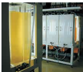
50リットル型種培養槽

大量培養した餌料は、併設する種苗生産施設の貝類種苗でも給餌され、いつも品質を確かめながら培養を行っています。また、安定した品質での供給実績から全国の種苗生産・中間育成施設でご使用いただいております。