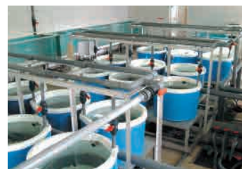
貝類種苗飼育水槽