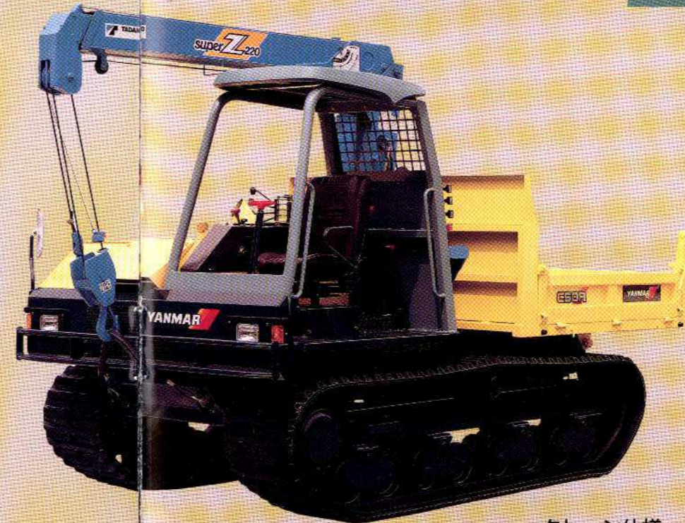
クレーン仕様 (オプション)

●駆動輪、下部ローラに足まわりの耐久性を向上させるフロティングシール採用。 ●インシュモータの採用で高い最低地上高を確保。ワイド履帯と相まって湿地・軟弱地もパワフルに走破!