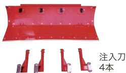
土壤消毒 SET DS-SET,MLCA

また薬剤タンクをトラクターの前方に配置したことにより、交換作業がラクに行えます。