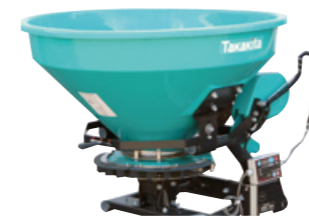
ブロードキャスト