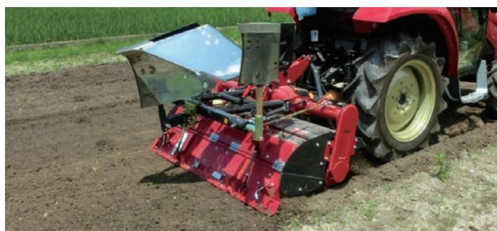
※写真は別売の培土器と畔際処理器が装着されています。