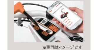
※画面はイメージです