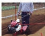
1 定植溝掘り作業用装着時