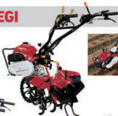
2 埋め戻し作業用装着時