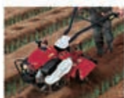
3 揚土作業用装着時