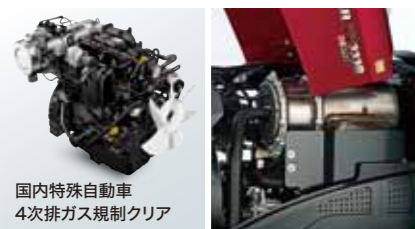
国内特殊自動車 4次排ガス規制クリア