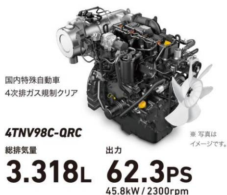
<大排気量・高出力COMMON RAILエンジン>

総排気量 3,318cc、出力 45.8kW(62.3ps)のCOMMON RAILエンジン搭載により、負荷が大きくなる湿田での稲刈り作業などでも、エンジン回転が落ちることなく安定した作業が行えます。また、定格回転が低いため、振動・騒音が小さく快適な作業を実現します。