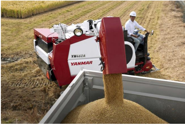
< 穀の排出イメージ >