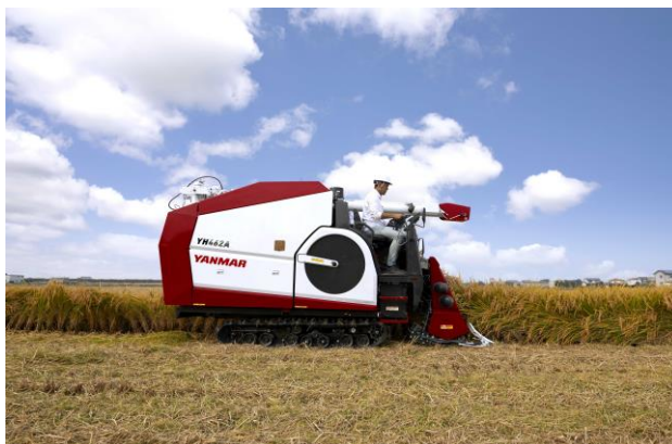
<YH462A 稲刈り作業イメージ>