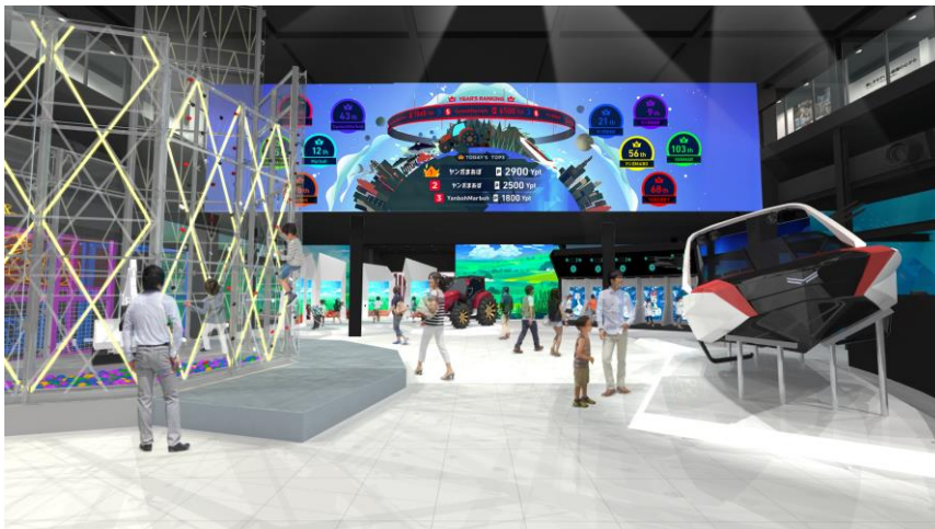
<ヤンマーミュージアム、館内イメージ>

ヤンマー株式会社(本社:大阪市、社長:山岡健人)は、ヤンマー100周年記念事業の一環として、創業者山岡孫吉の生誕地である滋賀県長浜市に設立したヤンマーミュージアムを、2019年10月5日(土)にリニューアルオープンします。