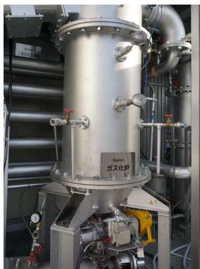
<特許技術を採用したガス化炉>

農業残さであるもみ殻は適切な処理を行わないと有害物質である結晶質シリカが発生します。当社のもみ殻ガス化発電システムは、特許技術により有害物質を発生せず、環境や健康に配慮したもみ殻処理が可能となります。また、もみ殻処理にかかる費用を削減するとともに熱電供給を行えるため、コスト削減と省エネを実現します。