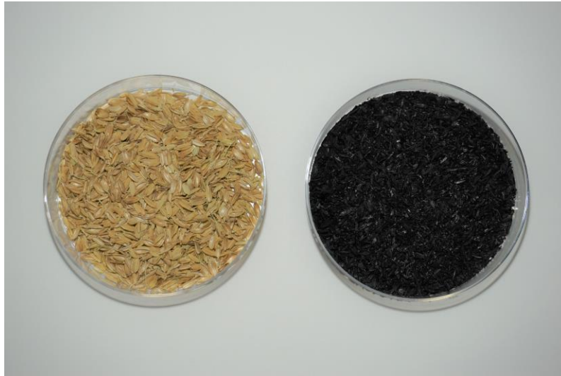
<排出される「もみ殻」と、もみ殻燃焼後に発生する「くん炭」>