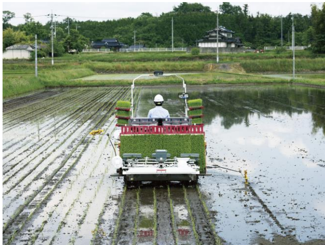
<密苗植付作業イメージ>

密苗は、慣行栽培とほぼ同じ管理方法で、規模や地域、品種に関わらず、収量も慣行と同等を確保することが可能です。今までと同じ面積を少ない育苗箱で植えることができるため、育苗箱や培土などの資材費を削減でき、播種や苗運びにかかる時間の短縮や人件費の削減、重労働による身体的負担の軽減に貢献します。この密苗技術と自動操舵を掛け合わせることで、稲作農業におけるさらなるコスト削減と省力化を実現します。