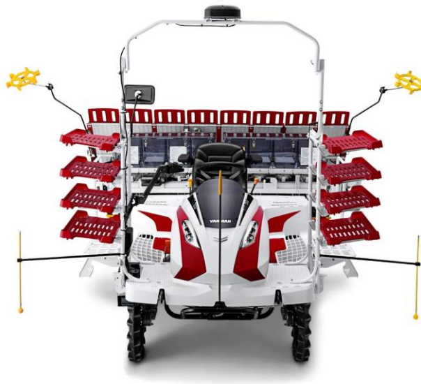
<直進アシスト田植機「YR8D」>

当社のグループ会社であるヤンマーアグリ株式会社(本社:大阪市、社長:北岡裕章)は、乗用田植機「YR-Dシリーズ」に自動直進機能を搭載した直進アシスト田植機「YR6D/8D」を2020年1月1日に発売します。