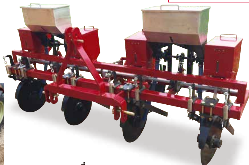
เครื่องหยอด 4 แถว