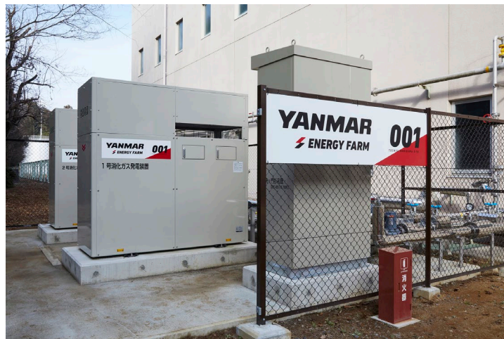
<YANMAR ENERGY FARM 栃木思川>

ヤンマーのグループ会社であるヤンマーエネルギーシステム株式会社(本社:大阪市、社長:山本哲也、以下 YES)は、発電事業者としてバイオガスを活用した FIT 発電事業を本格的に開始します。本事業における発電所の名称を「YANMAR ENERGY FARM(ヤンマーエナジーファーム)」とし、栃木県の思川浄化センター内および大岩藤浄化センター内に設置した発電設備を、2020年2月27日より順次稼働します。