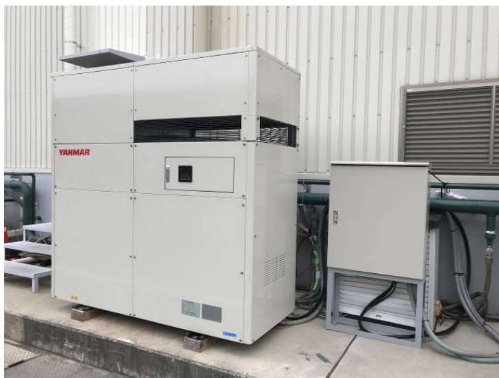
<実証試験で使用した発電機(左)と自動制御モジュール(右)>

今般、YES は経済産業省資源エネルギー庁の補助事業である「バーチャルパワープラント構築実証事業」に参画し、独自開発した自動制御モジュールでアグリゲーター※からの要請に沿って、自社の発電機を自動で稼働することに成功しました。