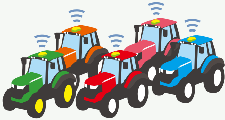
国産トラクター・輸入トラクター