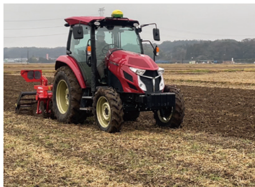
YT472Aトラクター + DTM16ディスクティラー