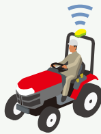
安全フレーム仕様