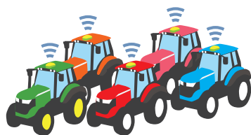
国産トラクター・輸入トラクター