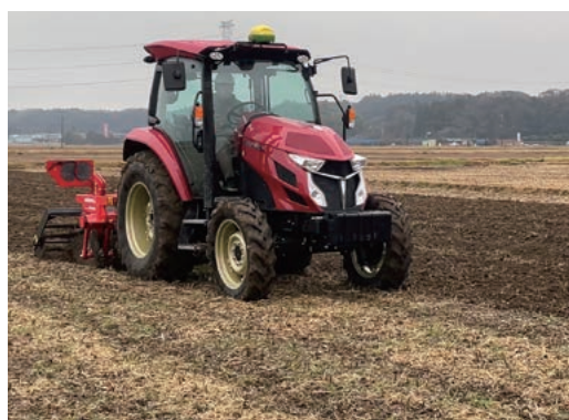
YT472Aトラクター + DTM16ディスクティラー