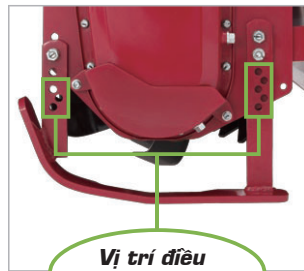
Vị trí điều chỉnh độ sâu xới