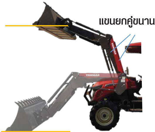
แขนยกคู่ขนาน

ไม่จำเป็นต้องปรับมุมของบังเก้ในขณะที่ขนถ่ายผลิตผล