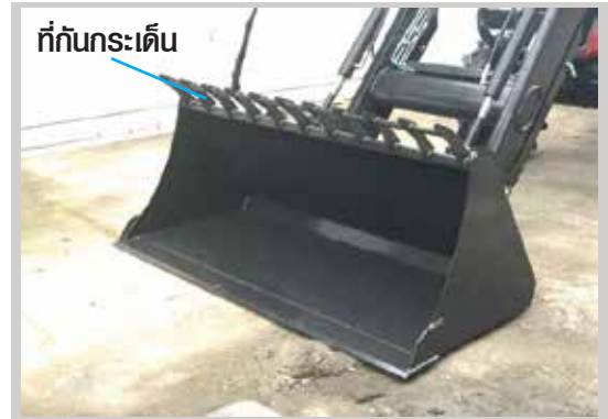
ที่กันกระเด็น

ถังบังเก้ใหญ่สามารถตักผลิตผลจำนวนมากๆ ได้ในครั้งเดียว ใช้งานได้ทั้งการเกษตรและงานก่อสร้าง