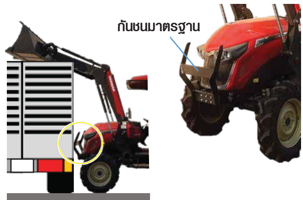
กันชนมาตรฐาน

ช่วยป้องกันการกระแทกกระท่างระหว่างแทรกเตอร์กับรถบรรทุกทุก ในขณะขนถ่ายได้เป็นอย่างดี