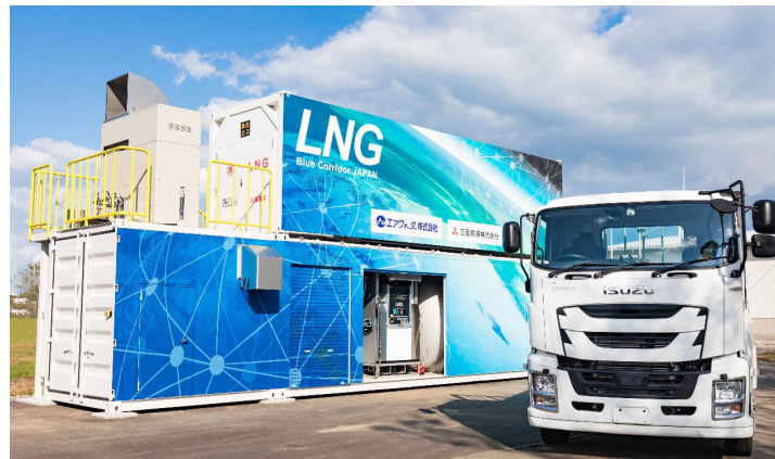
<小型LNG充填設備とLNGトラック>

YES ではこれまで約 9,500 台にのぼるガスコージェネの納入実績があり、オンサイトで効率よく電気や温水を生み出し、安定的な運用を続けてきました。今回の実証試験においては、事業者が小型 LNG 充填設備のタンク内で発生する BOG(気化メタンガス)の活用方法を検討する中で、YES 製のガスコージェネが採用されました。