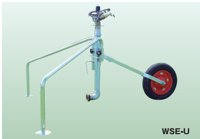
WSE WSE-U 植栽高、畝高が高い場合に使用