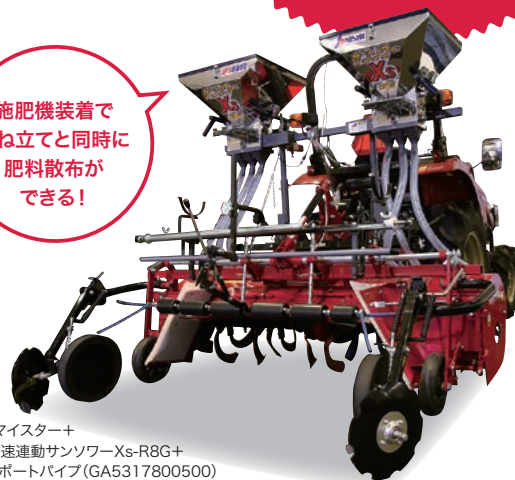
ベッドマイスター+ GPS車速運動センサーXs-R8G+ 延長サポートパイプ(GA5317800500)