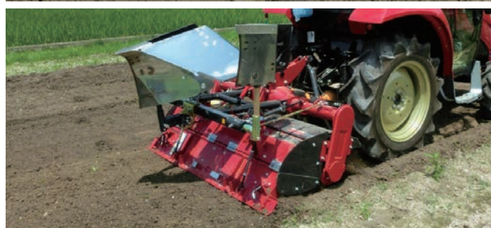
※写真は別売の培土器と畔際処理器が装着されています。