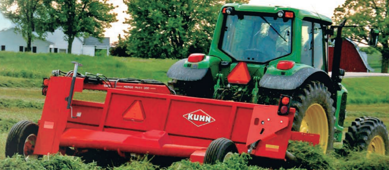
*写真は米国仕様につき、日本仕様とは異なります。