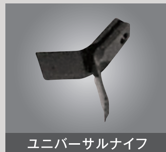
ユニバーサルナイフ