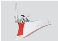
アポロ培土器 B プラス MC