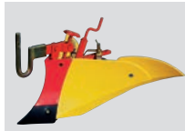
ニューイエロー 培土器 MC