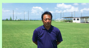
グラウンドでご使用のお客様