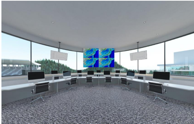
<「アフターサービス・コンタクトセンター」フロア>