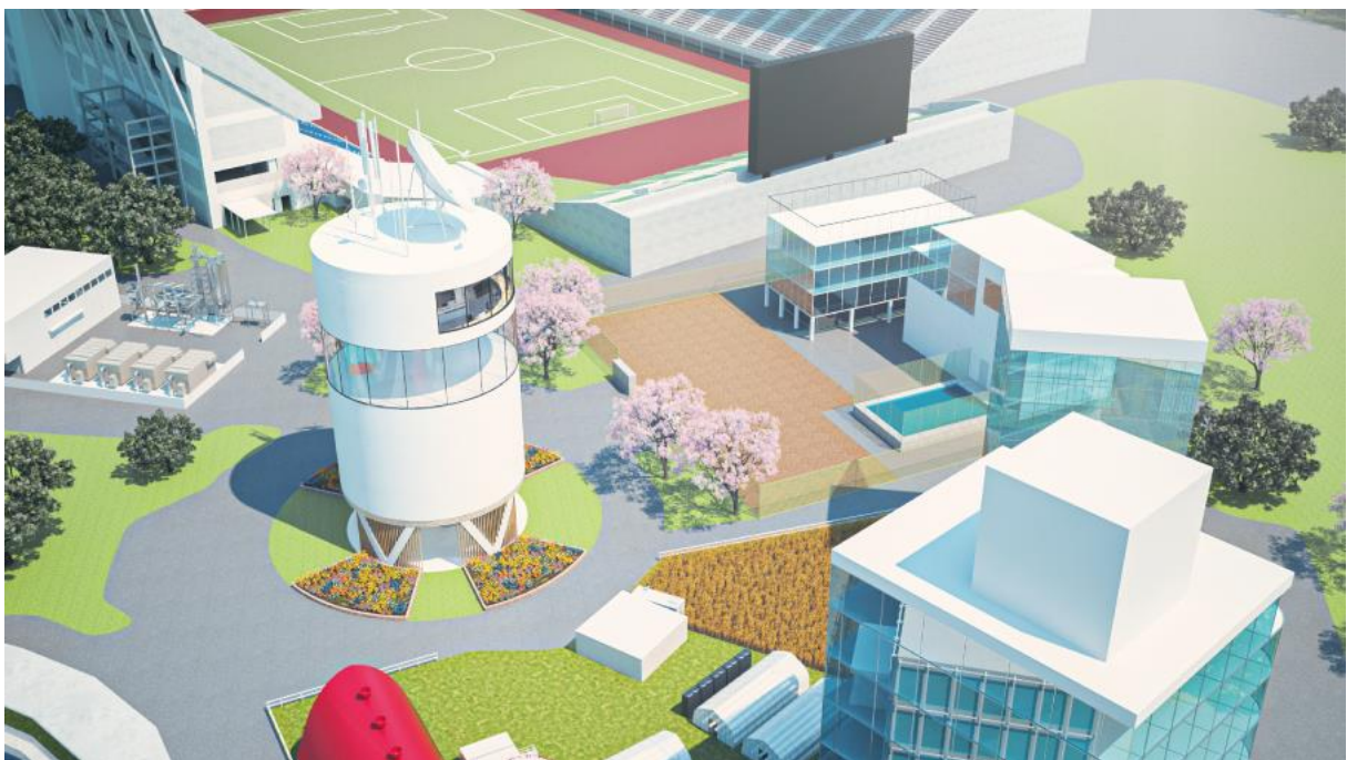
<「ヤンマーエネルギーシステム オンライン EXPO 2021」>

ヤンマーホールディングス株式会社のグループ会社であるヤンマーエネルギーシステム株式会社(本社:大阪市、社長:山本哲也、以下 YES)は、ビルや病院などのエネルギーの流れを見える化し、最適なソリューションを提案するオンライン展示会「ヤンマーエネルギーシステム オンライン EXPO 2021」を8月17日より開催します。