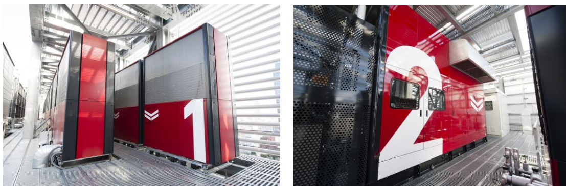
<左:ヤンマー本社ビルの GHP、右:停電対応の常用コージェネレーション>

「発電システム・ポンプエンジン」フロアでは、停電時にも電力を供給する非常用発電機や、洪水や浸水などの被害を抑えるポンプ駆動システムなど BCP 対策に貢献するシステムを紹介します。