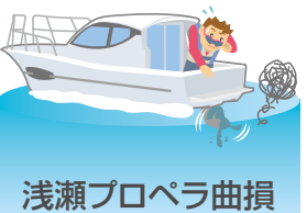
浅瀬プロペラ曲損