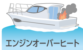
エンジンオーバーヒート