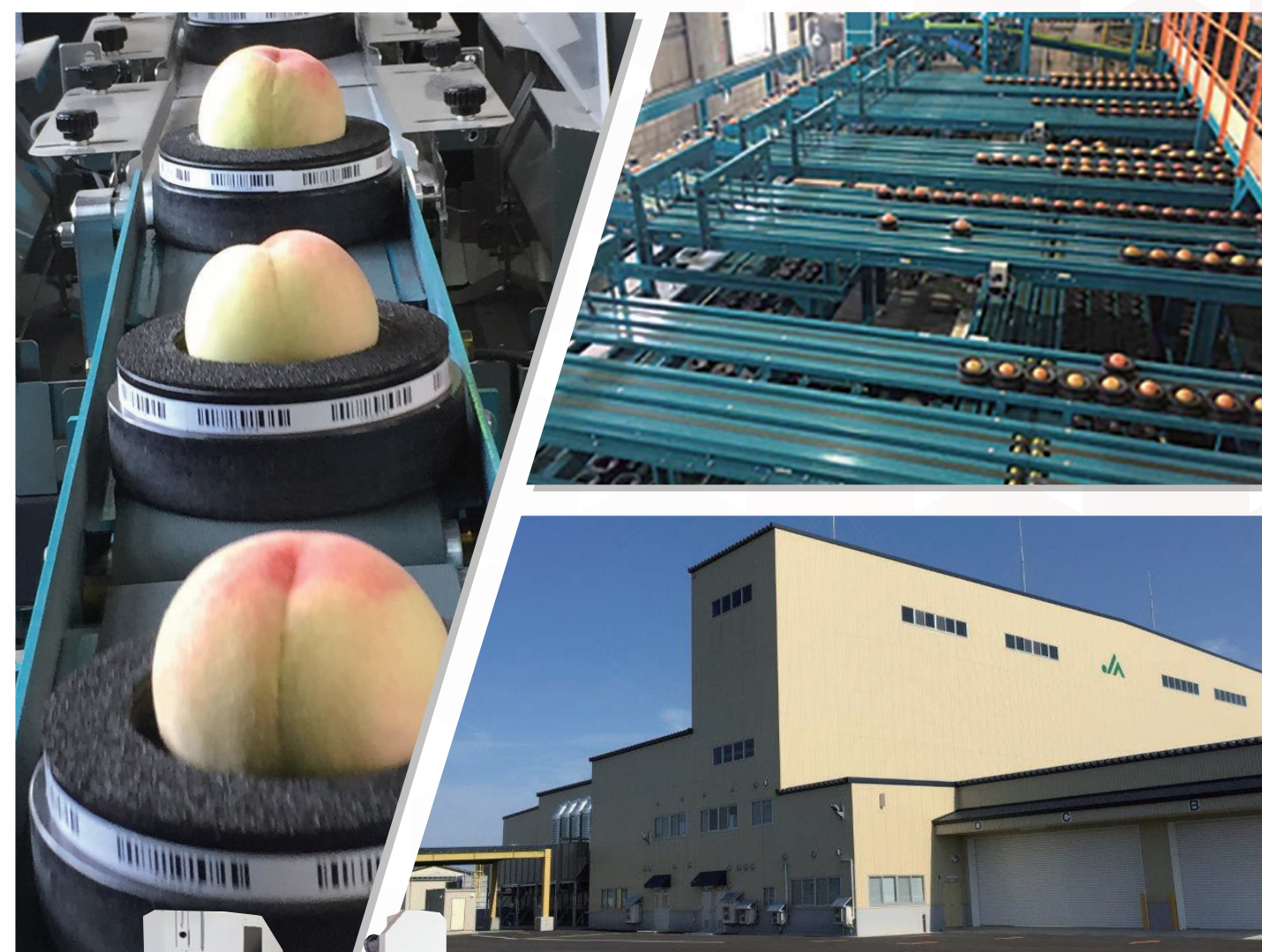
完成施設及び新商品