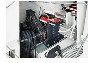
【ロール部のベルト駆動】