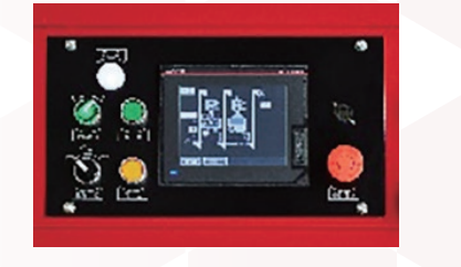
【操作部のタッチパネル】