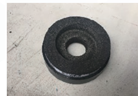
【白桃用パン】 全周をスポンジで覆っています