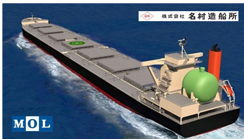
<実船実証を予定している大型石炭専用船 CG>