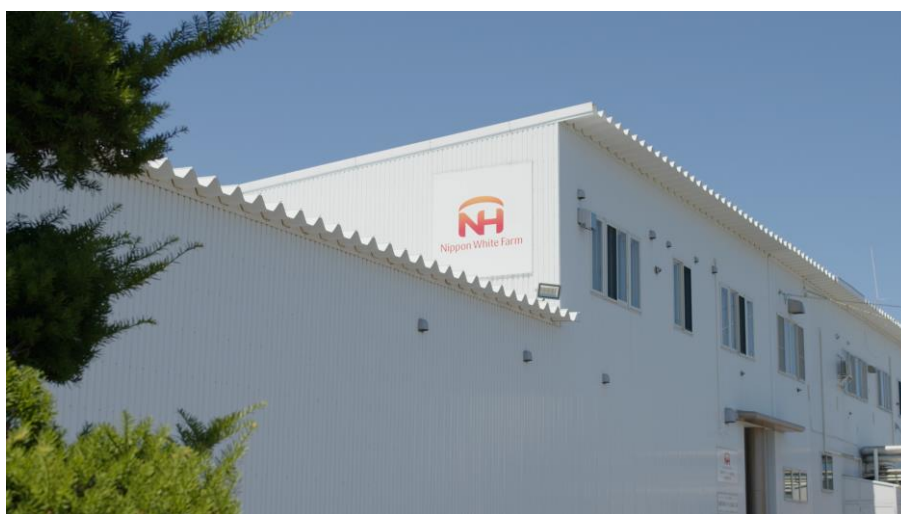
<日本ホワイトファーム株式会社 知床食品工場>