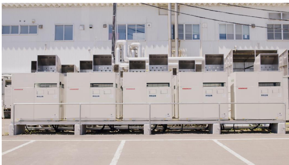
<日本ホワイトファームに設置したコージェネレーションシステム>

ヤンマーホールディングス株式会社のグループ会社であるヤンマーエネルギーシステム(本社:大阪市、社長:山本哲也、以下 YES)が、日本ホワイトファーム株式会社、アストモスエネルギー株式会社、株式会社イーネットと共同で取り組んだ「EMS を軸とした LPG コージェネによる省エネと BCP 対策の実現」が「2021 年度 コージェネ大賞」の産業用部門において「特別賞」を受賞しました。