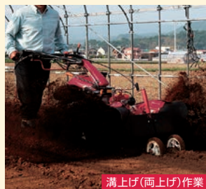
溝上げ(両上げ)作業