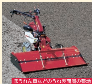
ほうれん草などのうね表面層の整地