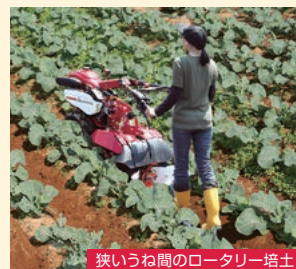
狭いうね間のロータリー培土