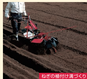
ねぎの植付け溝づくり