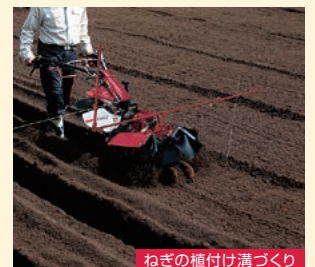
ねぎの植付け溝づくり