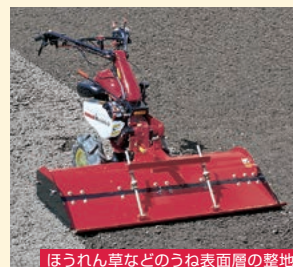
ほうれん草などのうね表面層の整地