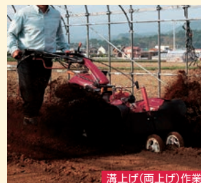
溝上げ(両上げ)作業