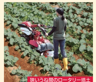
狭いうね間のロータリー培土