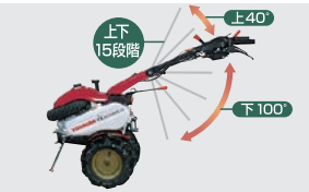
ハンドル上下調節