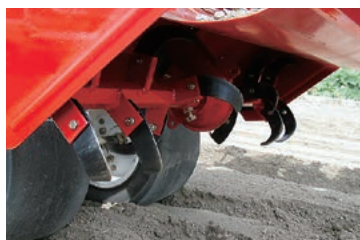
表面耕起用爪軸(耕幅900mm)と整地板