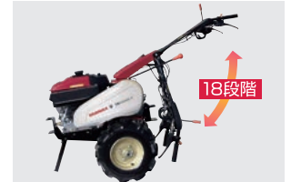
ハンドルロックレバー