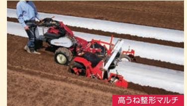
高うね整形マルチ