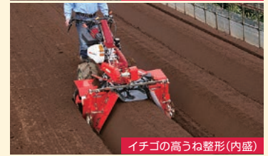
イチゴの高うね整形(内盛)