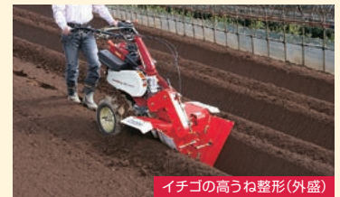
イチゴの高うね整形(外盛)